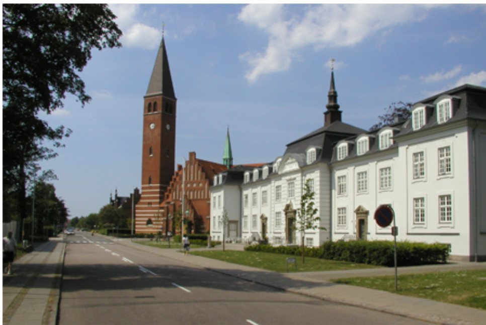
Områdets flotte og markante bebyggelser ligger som perler på en snor langs Saxogade.

Et andet træk, der ønskes bevaret, er områdets grønne og ordnede karakter - de græsklædte arealer og store flotte træer.