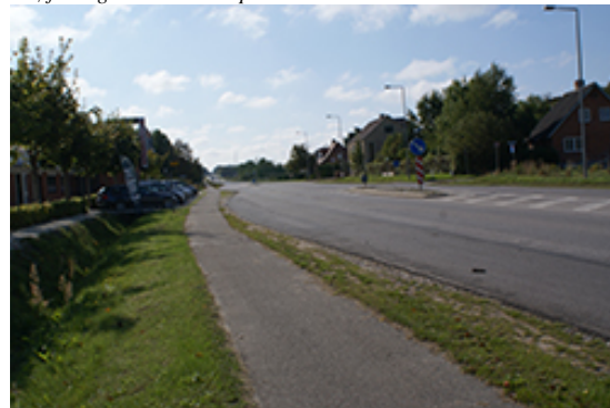
Bilgården Hostrup set fra Sulsted Landevej.