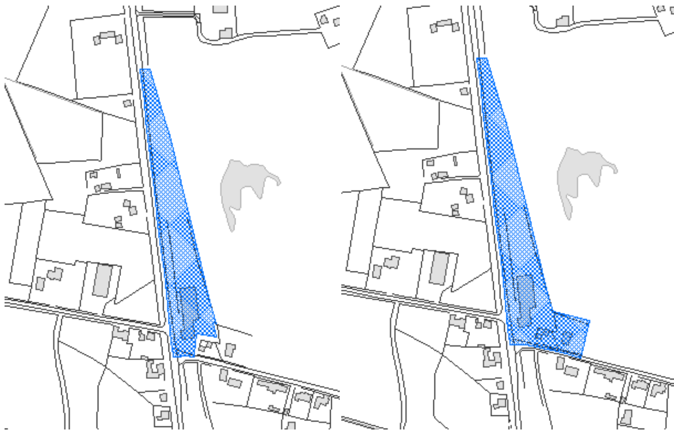
Gældende område til "Særlig pladskrævende varer".