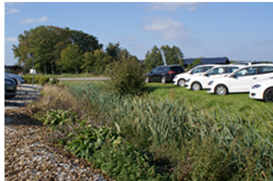
Groft Bilgården Hostrup.

Planerne omfatter ikke projekter eller anlæg opført på bilag 1 eller bilag 2 i ovennævnte bekendtgørelse. Derfor skal der ikke udarbejdes en VVM-screening eller en VVM-redegørelse.