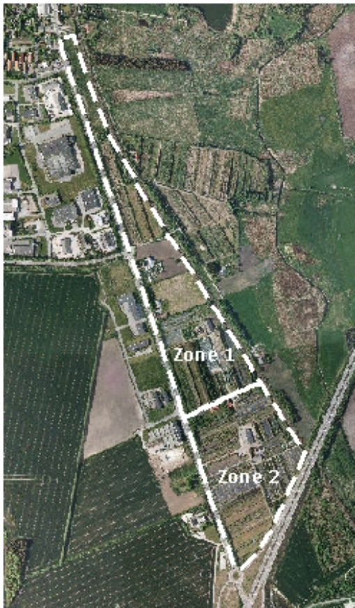
Zoneinddeling for udbygning