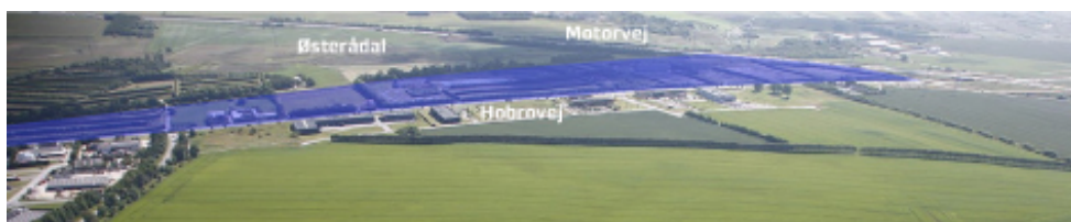
Specielt langs Hobrovej og mod Ådalen stilles der høje æstetiske krav til bebyggelse og forarealer.

Områdets landskabelige kvaliteter gør, at der også stilles særlige krav til, at bebyggelsens udformning og placering spiller positivt sammen med terrænet i ådalen.