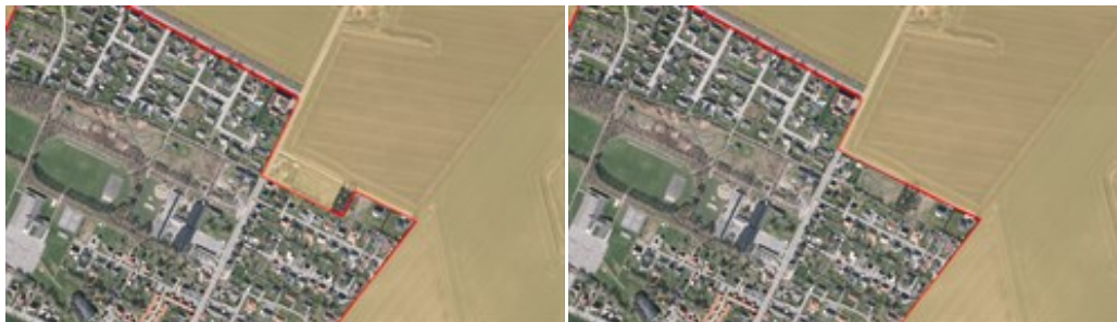
Gældende retningslinje for øvrige landområder