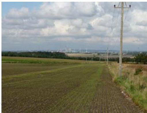
Udsigt ind mod Aalborg