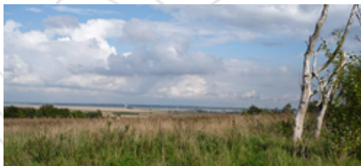
Rekreativt område med udsigt til Limfjorden

Området er et stort sammenhængende areal (ca. 20 ha), og der bør derfor udarbejdes en samlet plan for udbygning af området sammen med det udlagte perspektivområde vest for