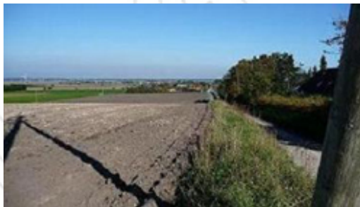
Området, hvor byudviklingen skal foregå, er i dag bar mark

En kommende lokalplan for området skal ligeledes sikre, at en fremtidig bebyggelse skal tilpasses de særlige kulturværdier, der findes ved Sejflod Kirke, og sikre indsiget til og udsyn fra kirken.